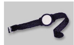
Transponder - Uhr